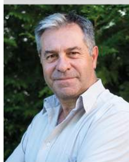
Gérald Lucas « Dans le ventre de la déesse » A la suite d'une « rencontre » musicale, un photographe replonge dans ces écrits épistolaires, réflexions couchées vingt ans plus tôt lors d'une expédition en Himalaya, à l'Annapurna. Roman qui s'inspire d'une histoire vraie, « Dans le ventre de la déesse » retrace le voyage initiatique d'un homme non programmé pour une contrée si lointaine, si haute et si belle.